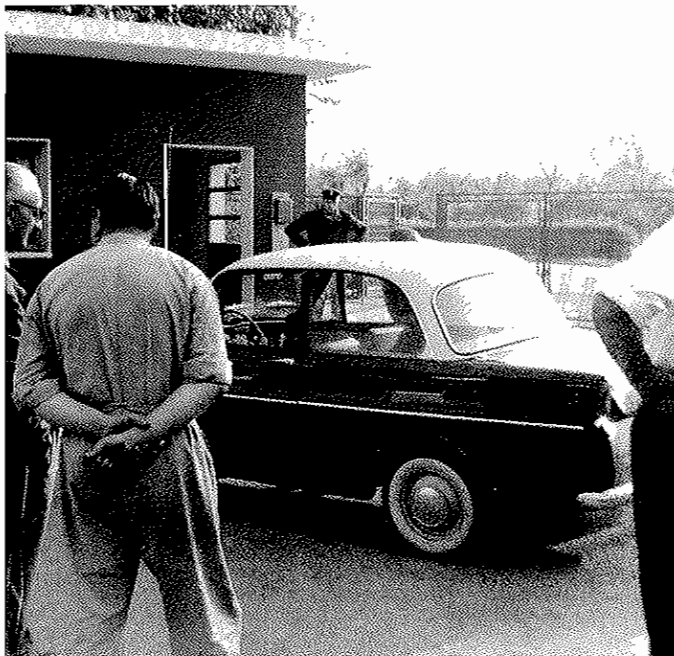
De eerste DAF-persenenauto was goed voor veel nieuwsgierige blikken. Zo ook in Maranello waar deze Daffodil (met de variomatic) door Enzo Ferrari zelf (geheel links op de foto) kritisch werd bekeken.

betalen?" Waarop ik antwoordde: "Nee, natuurlijk niet. Maar ik wil hem gewoon hebben!" De Prins vond het een prachtig antwoord en bracht een toast uit op m'n nieuwe auto.