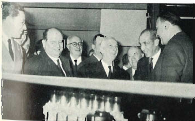
Lo stand Ferrari al Salone internazionale dell'automobile di Torino è stato onorato dalla visita del Presidente della Repubblica Antonio Segni. Insieme al Capo dello Stato, il ministro Togni e il conte Rodolfo Biscaretti Di Ruffia, presidente dell'Anfia.